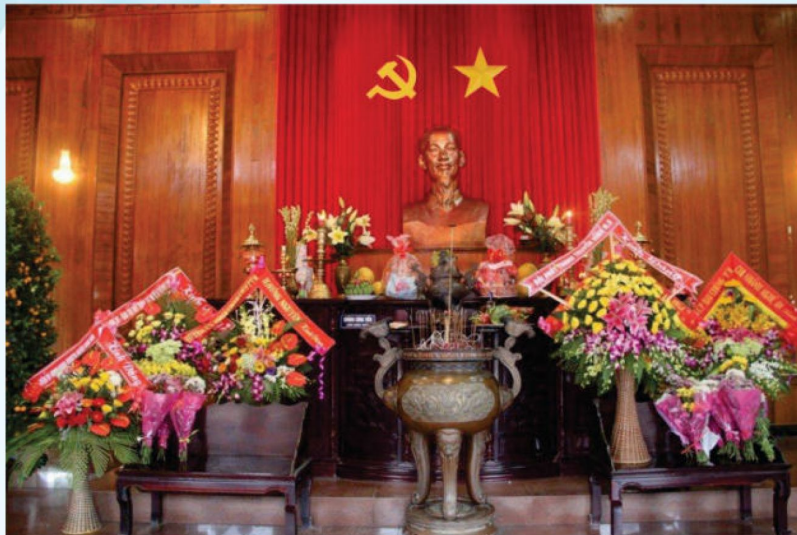
Hình 21c - Trong đền thờ chính

Điều 12. Nơi tổ chức các hoạt động đối ngoại đảng, ngoại giao nhà nước