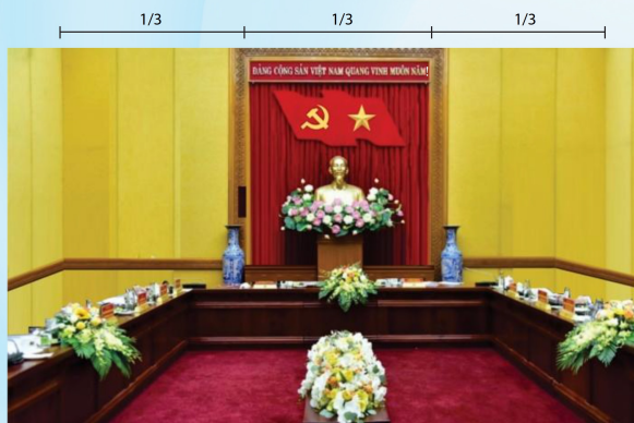
Hình 4b (kích thước hội trường nhỏ)