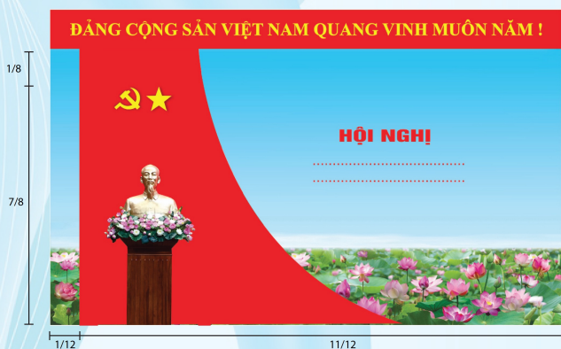
Hình 5b (cờ xếp chéo đơn)