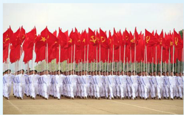
Hình 24b (rước theo hàng)