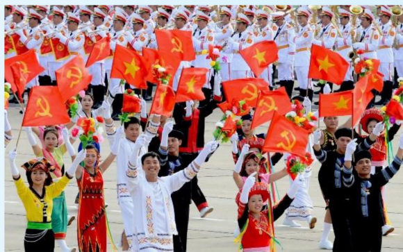
Hình 23d (vẫy bằng tay)