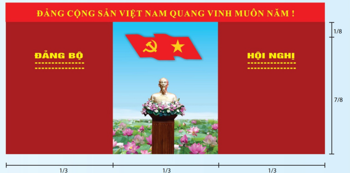
Hình 4a (kích thước hội trường rộng)