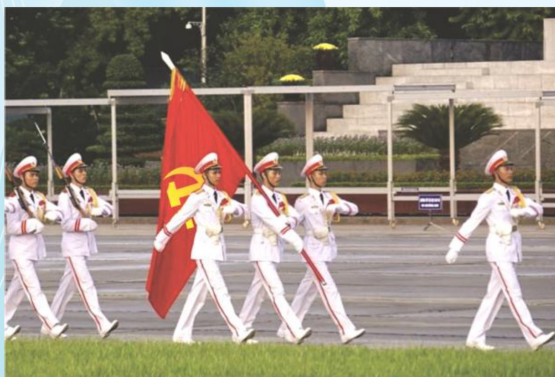
Hình 23c (vác cờ)