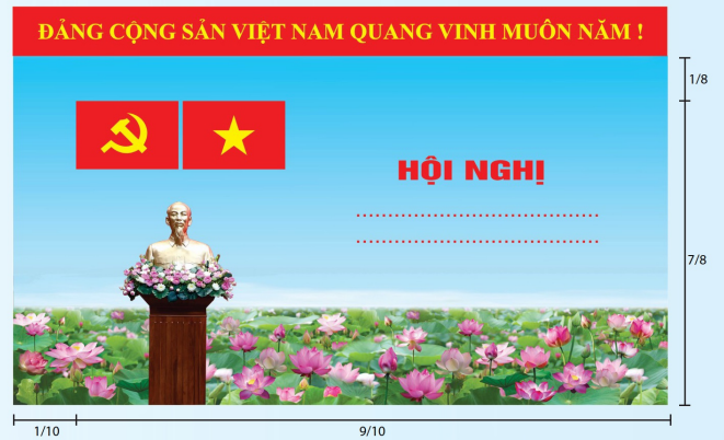
Hình 3a (cờ không tạo sóng)