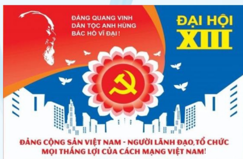
Hình 31b (panô tuyên truyền)