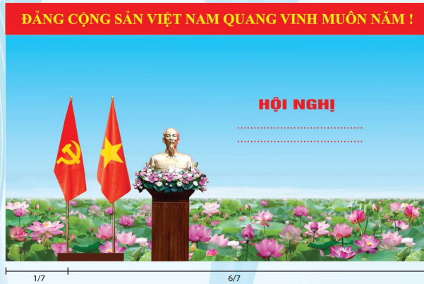
Hình 2 (Cờ có cán)