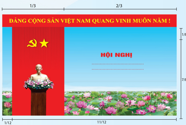
Hình 5a (cờ xếp dọc)