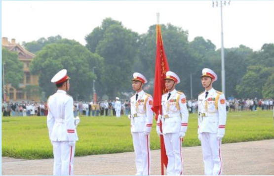
Hình 23a (cầm cờ)

Điều 13. Cầm, rước cờ Đảng khi tổ chức các hoạt động, mít tinh, diễu binh, diễu hành