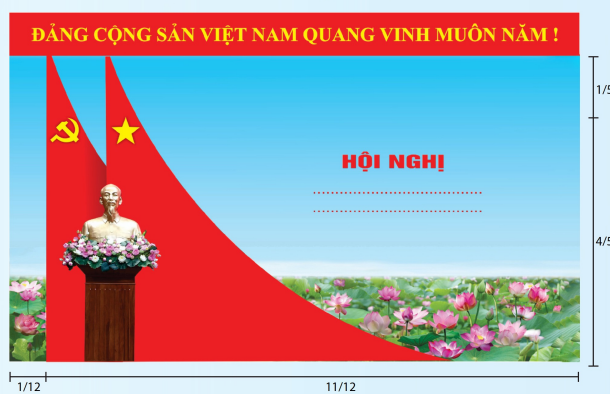
Hình 5c (cờ xếp chéo đôi)