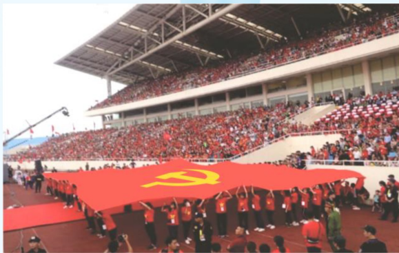
Hình 24a (rước cờ vai)