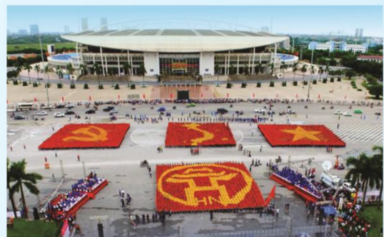
Hình 32 (xếp bằng người)