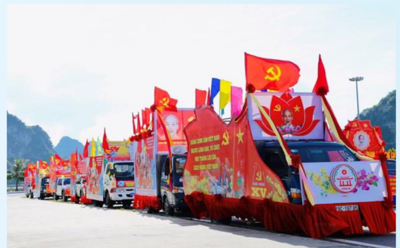
Hình 24d (rước bằng xe)