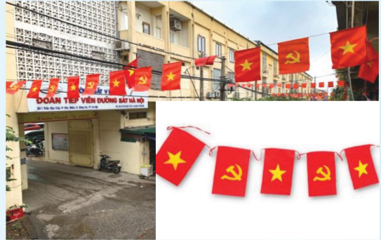
Hình 16b (cờ dây)