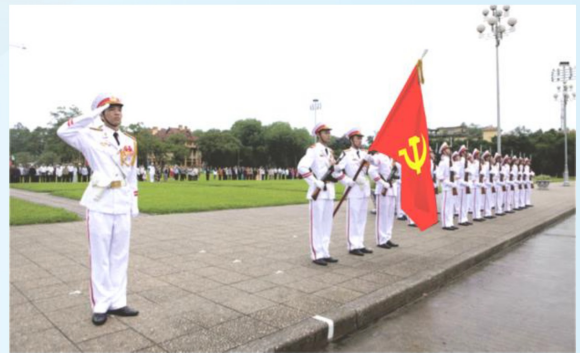
Hình 23b (giương cờ)