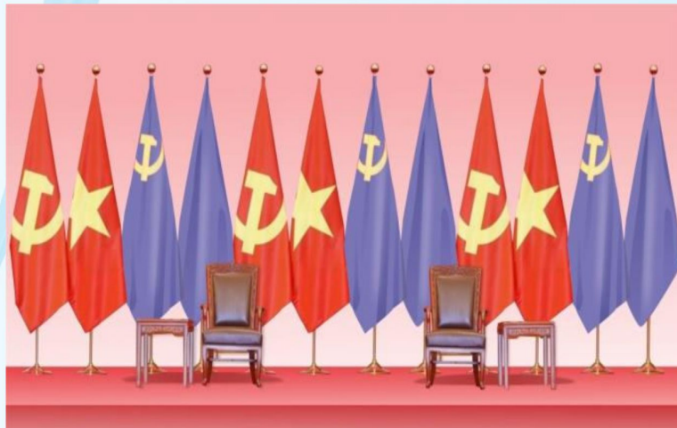
Hình 22 - (2 cờ màu tím là minh họa cờ Đảng và Quốc kỳ nước khách)

Điều 12. Nơi tổ chức các hoạt động đối ngoại đảng, ngoại giao nhà nước